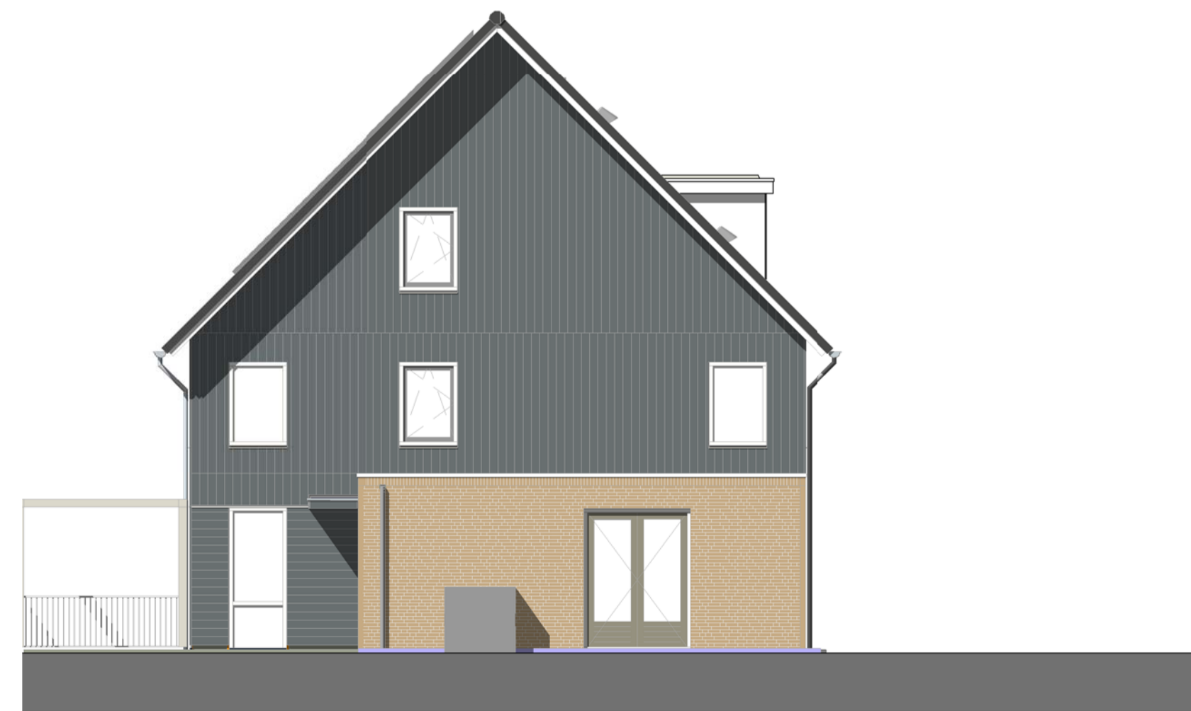
Rechterzijgevel Bouwnummer 17

Bouwnummers: 10 - 11 - 16 - 17 - 26 - 27