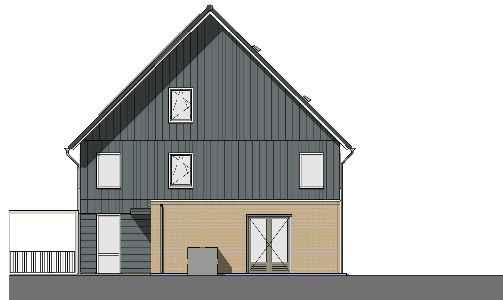
Rechterzijgevel Bouwnummer 17

Bouwnummers: 10 - 11 - 16 - 17 - 26 - 27